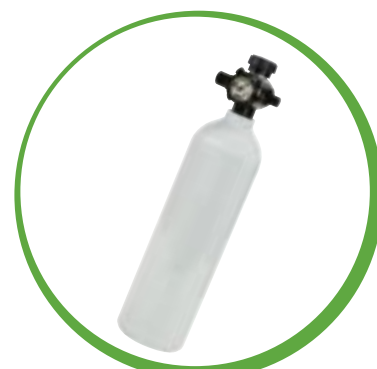
Cilindro de Alumínio