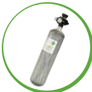
Cilindro de Fibra de Carbono